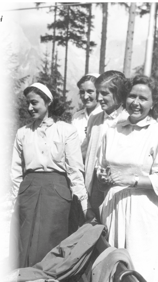
Chiara Lubich (da un'intervista a Tonadico, 4 gennaio 1995)

“Qui noi siamo venute per riposarci. Però i piani di Dio erano diversi su di noi e invece che lasciarci riposare semplicemente ci ha portate un po’ nella contemplazione. Sono cadute delle grazie particolari che io attribuisco al fatto che la nostra era un’Opera di Dio per cui si è anche, in certo modo, previsto, non nei dettagli, ma nell’insieme, quello che sarebbe stato lo sviluppo dell’Opera di Maria nella Chiesa. E sono state tante le luci che abbiamo ricevuto, che ci siamo comunicate fra di noi, per cui è nata l’idea del “Paradiso”. Ci sembrava cioè veramente di essere in qualche modo trasferite in un altro cielo, e questo era..., è una realtà fra di noi”.